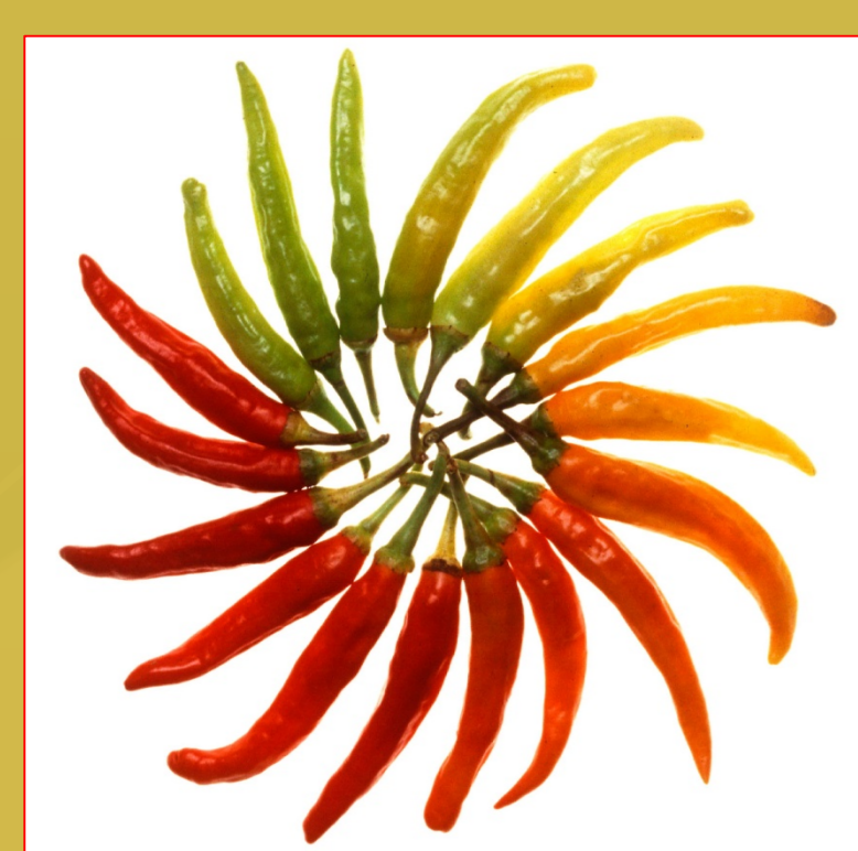
Peperoncino Capsicum spp.