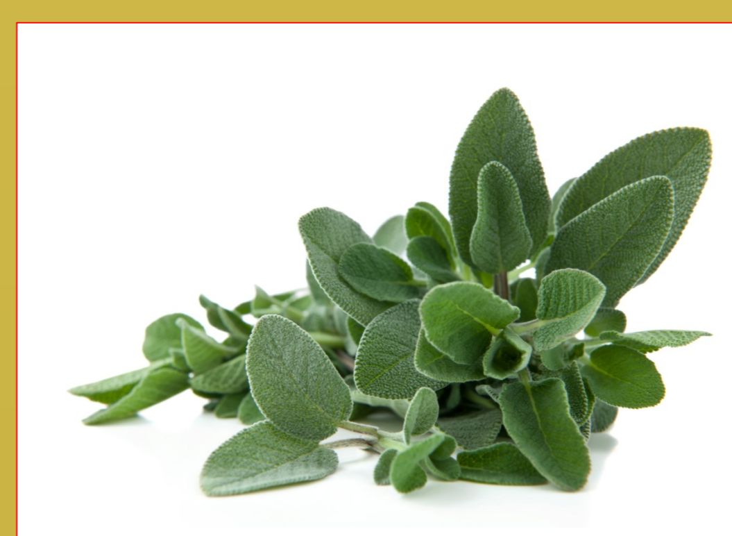
Salvia Salvia officinalis L.