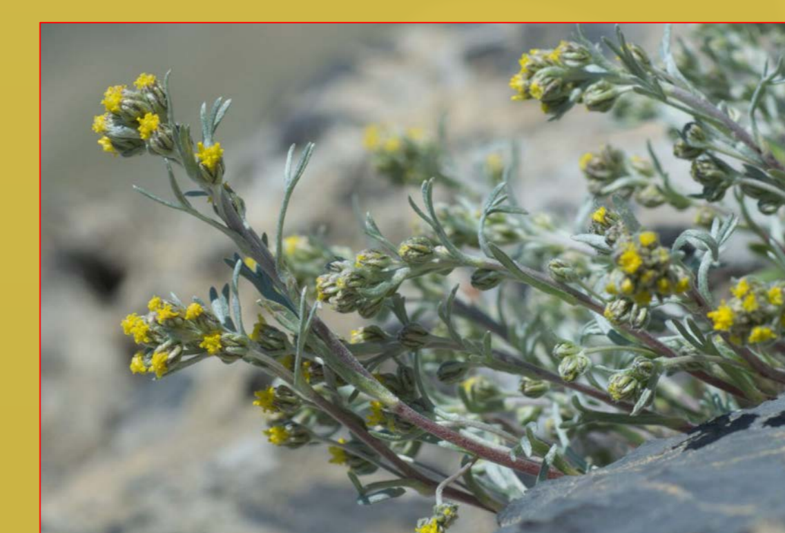
Genepi Artemisia spp.