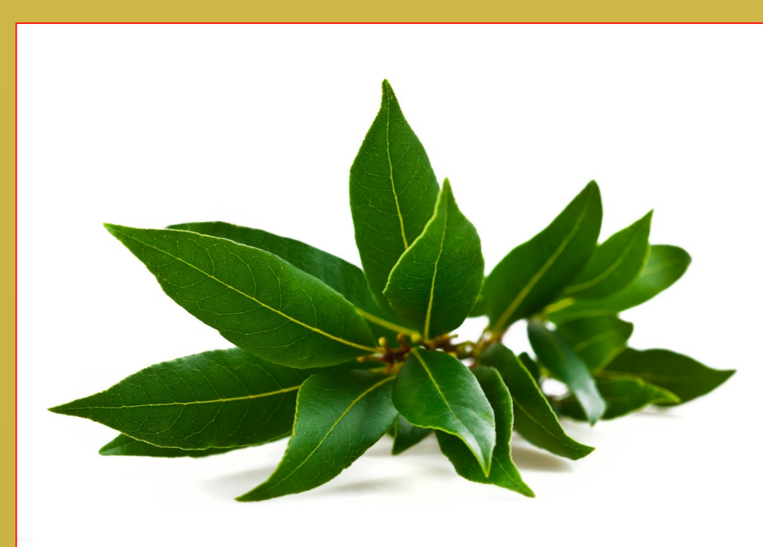
Alloro Laurus nobilis L.