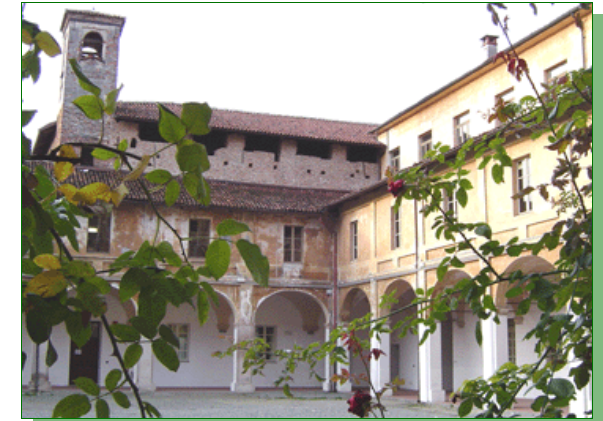
Aula Magna "St. Chiara" P.tta Baralis, 4 SAVIGLIANO (CN)

Progetto Europeo di Rafforzamento delle Lauree Professionalizzanti